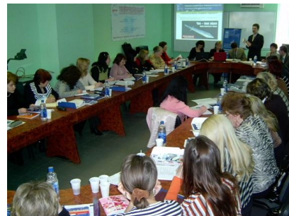
Фото – 16: Тренінг для вчителів в м. Івано-Франківськ

В цілому, 133 жителі здобули ґрунтовні знання по презентованій темі та отримали повний набір інформаційних матеріалів. Тренінги такого типу проводились за фінансової підтримки проекту ЄС та ПРООН «Спільнота споживачів та громадські об'єднання», а МПВСР через муніципальні відділи підтримки у містах надавала організаційну підтримку. Проведення таких тренінгів планується продовжувати протягом року на користь інших міст-партнерів МПВСР, а саме: Кіровське (Донецька область), Рубіжне (Луганська обл.), Вознесенськ, Миколаїв (Миколаївська обл.), Гола Пристань (Херсонська обл.) та Львів.