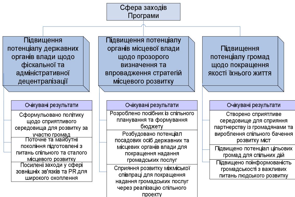
Схема - I: Бачення сфер заходів МПВСР у 2008 році

Пріоритетні сфери діяльності Програми схематично зображені на схемі I.