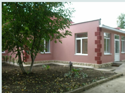
Фото – 7: Зовнішній вигляд Центру соціальної реабілітації

Було заплановано, що Центр повинен мати басейн, дитячий майданчик, зал лікувальної фізкультури, навчальний комплекс, медпункт, їдальню та приміщення для надання ін. послуг.