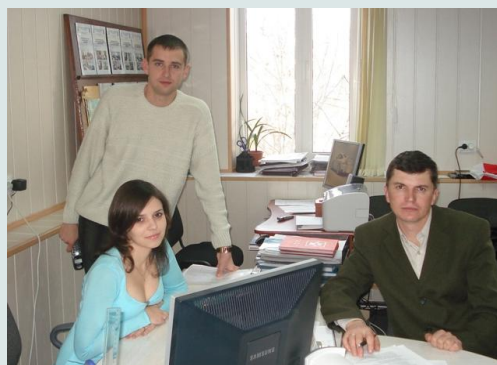
Фото – 3: Персонал Вознесенського МВП за роботою

18 серпня 2006 р. була укладена «Угода про партнерство» між Вознесенською міською радою та ПРООН/МПВСР на предмет реалізації заходів Програми в місті. Метою Програми на місцевому рівні є покращення рівня життя населення міста за допомогою вирішення його місцевих економічних, соціальних та екологічних проблем на засадах самопомогі. Для координування роботи між громадами, міською радою та МПВСР, Вознесенська міська рада прийняла рішення від 28.09.2006 р. про створення відділу підтримки муніципальних ініціатив та інвестицій. Головною метою діяльності відділу є залучення додаткових ресурсів для соціального та економічного розвитку міста.