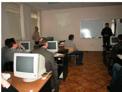
Фото – 18: Тренінг по розвитку навичок в бізнесі

Хід проведення тренінгів ілюстровано на фотографіях нижче.