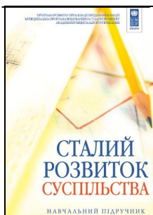
Рисунок – І: Посібник з викладання сталого розвитку

Досвід українських міських рад показує, що існує не так багато фахівців та науковців, які спеціалізуються на питаннях децентралізації, демократичного врядування, соціальної мобілізації, сталого розвитку громад. Це вказує на те, що наявні людські ресурси не відповідають сучасним потребам країни. Оскільки політика МПВСР в цій сфері була визнана партнерами Програми ефективною, існує можливість розширити масштаби її діяльності та готувати майбутніх лідерів та активістів сталого розвитку громад на національному рівні.