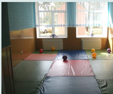
Фото – 8: Зал лікувальної фізкультури в новому Центрі