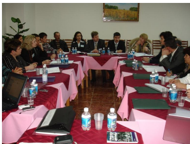
Фото – 22: Робочі дискусії під час семінару

Упродовж семінару учасники обговорювали існуючий досвід та форми самоорганізації жителів, шляхи посилення їхньої життєздатності та механізмів взаємозв'язків з місцевою владою та НГО для сприяння місцевому розвитку.