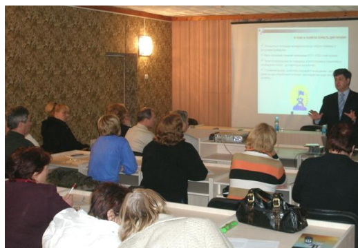
Фото - 11: Хід тренінгу для жителів м. Саки, лютий 2008

У результаті проведених тренінгів, жителі ознайомилися з законодавчою базою щодо створення об'єднань співвласників багатоквартирних будинків, обслуговуючих кооперативів та інших організаційно-правових форм організацій громад, а також із специфікою їхньої діяльності. Жителі також дізналися про процес участі громадян в заходах ПРООН/МПВСР шляхом ініціювання та впровадження проектів сталого розвитку та громадських ініціатив.