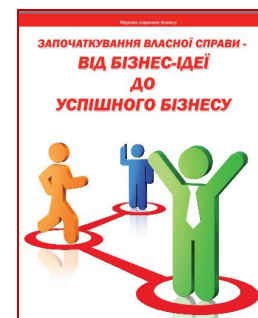
Фото – 20: Брошура “Започаткування власної справи: від бізнес-ідеї до успішного бізнесу” (укр. мовою)

Враження вигодонабувачів від проведення тренінгів подаються в Вставці – X.