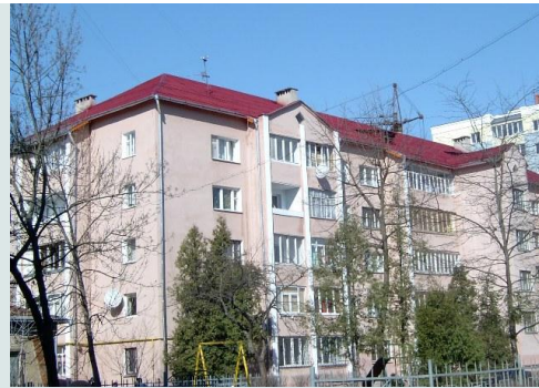
Фото – 10: Реконструйований дах будівлі за проектом ОСББ «Сучасне Життя»

Загальна вартість проекту – 146,8 тис. грн. – була розподілена наступним чином: 10% суми було надано власне громадою, 80,5% - Івано-Франківською міською радою та 9,5% – фондом ПРООН/МПВСП з коштів Посольства Норвегії.