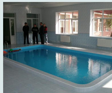
Фото – 9: Басейн, збудований за кошти громади

Вартість підтриманого Програмою проекту складала 179,5 тис. грн., з яких 29,6 тис. грн. (або 16,5%) було надано громадською організацією, 74,9 тис. грн. було надано в рівних частинах