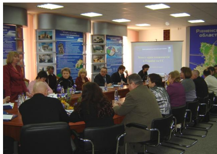
Фото – 14: Тренінг для представників місцевої влади та НГО в м. Рівне

Завдяки співпраці таких проектів ПРООН як «Спільнота споживачів та громадські об'єднання» та «Муніципальна програма врядування та сталого розвитку (МПВСР)» було заплановано проведення ряду тренінгів в містах України для підвищення поінформованості жителів у сфері прав споживачів та механізмів їхнього захисту. У рамках цієї співпраці, протягом кварталу було проведено 4 тренінги, включаючи тренінг для представників органів місцевої влади, НГО та ЗМІ в м. Рівне; тренінг для приватних підприємців та представників місцевих органів влади в м. Новоград-Волинський, та 2 тренінги для приватних підприємців, представників місцевих органів влади та вчителів місцевих шкіл в м. Івано-Франківськ.