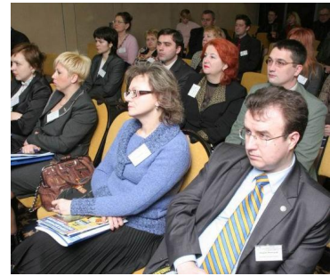
Фото – 23: Форум споживачів

Крім того, представники міст-партнерів МПВСР, включаючи Івано-Франківськ, Житомир, Новоград-Волинський, Галич, Українка, Рубіжне та інші, взяли участь у Всеукраїнському форумі споживачів, який було проведено проектом ССГО 11-13 березня цього року та присвячено Міжнародному Дню прав споживача. У Форумі взяло участь близько 150 активістів руху споживачів в Україні, включаючи представників органів державної влади, які залучені до захисту прав споживачів, та органів місцевого самоврядування, які зробили внесок в розбудову національної політики споживачів. Очікується, що міста-партнери Програми, що взяли участь у заході, поділяться досвідом та знаннями у цій сфері з місцевими зацікавленими сторонами.