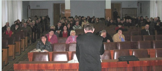
Фото- 4: Громадські слухання в Новограді-Волинському

У ході зустрічі, її учасники дізналися про місцеві історії успіху з розповідей представників місцевих громад (жителів, освітніх закладів, громадських організацій) та перегляду документального фільму «На сходинку вище: як українські громади допомагають самі собі», створеного ПРООН також і на основі досвіду новоград-волинських громад. Доповідачі заохотили представників місцевих організацій громад брати більш активну участь у вирішенні своїх власних пріоритетних проблем розвитку.