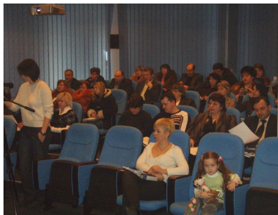
Фото – 15: Тренінг для підприємців в м. Новоград-Волинський