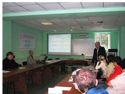
Фото – 19: Захист бізнес-планів учасниками тренінгів