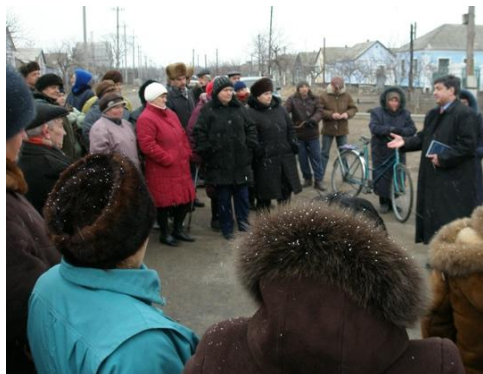
Фото – 2: Зустріч з організацією жителів у Вознесенську

зовнішніх ресурсів для реалізації ініціатив розвитку та забезпечення сталості зусиль із розвитку.