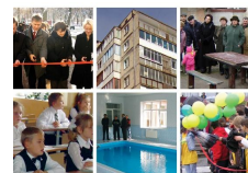
ПРОЕКТИ ГРОМАД МЕТОДИЧНІ РЕКОМЕНДАЦІЇ ЩОДО ПІДГОТОВКИ ТА ВПРОВАДЖЕННЯ