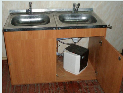
Фото – 5: Фонтанчики питної води «Криничка 10» розміщені в кожній місцевій школі

Тому у ході шкільного конкурсу на тему «Якби я був директором школи» багато дітей написали, що в цьому випадку вони б зробили все можливе, щоб у школах діти могли пити чисту, якісну та смачну воду після уроків фізкультури чи під час спекотного літа. Ідея встановлення фонтанчиків питної води з фільтрами додаткового очищення була обговорена під час зустрічі ректоратів шкіл та затверджена для розгляду мережею шкіл «Сприяння розвитку освіти «Діалог».