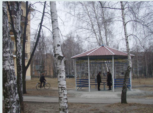
Фото – 6: Члени громади використовують бует для отримання питної води

Квартальний комітет був зареєстрований 50-ма представниками (36 чоловіків та 14 жінок) всіх багатоквартирних будинків мікрорайону у 2007. Члени комітету провели численні зустрічі з жителями будинків, в яких вони проживають, поширили інформаційні матеріали в мікрорайоні для підвищення рівня залученості громади в проект, та координували спільну розробку та виконання проекту. З загальної вартості проекту, яка становила 129,8 тис. грн, 10% було надано членами комітету, 49,5% - міською радою м. Новоград-Волинський, та 40,5% - ПРООН/МПВСР. Громаді вдалося зробити внесок нефінансового характеру в виконання проекту, таким чином підвищивши вартість проекту на 1,1 тис. грн. (на 1%).